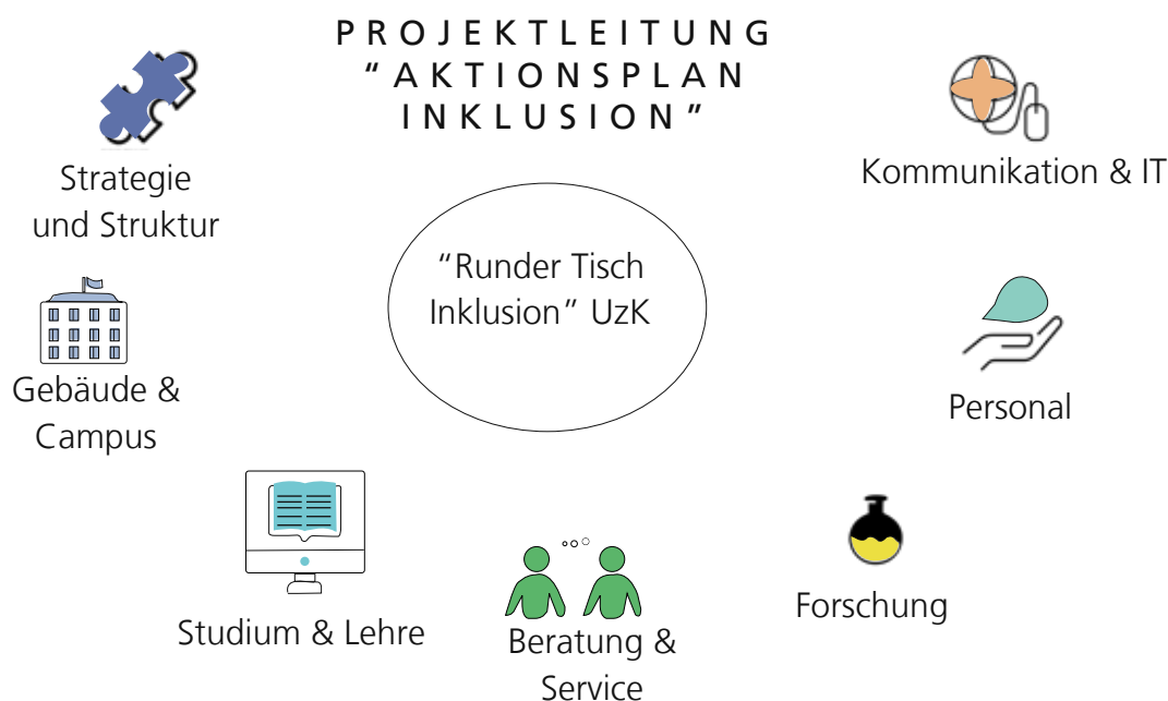
Abbildung 1: Projektstruktur des Teilprojekts „Aktionsplan Inklusion“

Im Sinne größtmöglicher Partizipation gemäß der UN-BRK waren die Expert*innengruppen jederzeit offen für weitere Interessierte, insbesondere für Menschen mit Behinderungen. Der Entwicklungsprozess, die Datenlage zu Beschäftigten und Studierenden mit Behinderung und eine Aufstellung von strukturellen Voraussetzungen und Rahmenbedingungen an der UzK sind im Anhang des Aktionsplans Inklusion dokumentiert. Der Aktionsplan Inklusion der UzK umfasst sieben Handlungsfelder 1) Strategie & Struktur, 2) Personal, 3) Forschung, 4) Beratung & Service, 5) Studium und Lehre, 6) Gebäude & Campus, und 7) Kommunikation & IT. Zu jedem Handlungsfeld werden die übergreifende Zielstellung, der Stand der Umsetzung, Handlungsbedarfe und geplante Maßnahmen skizziert.